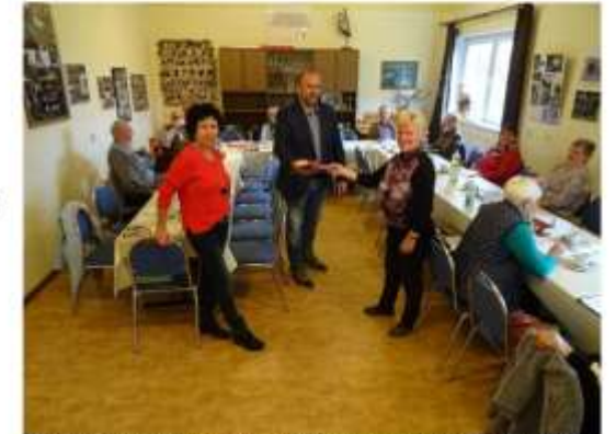
Seniorengruppe Marxdorf mit dem Beigeordneten und der Ortsvorsteherin vom OT Marxdorf.

„Alle freuen sich über die zur Verfügung gestellten Mittel. Das wertet die Gruppenarbeit auf und die Zufriedenheit der Nutzer an den gemeinschaftlichen Treffen steigt.“