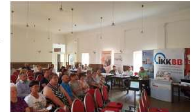
Foto: Veranstaltung "Barrierefrei" am 19.06.19 in Luckenwalde