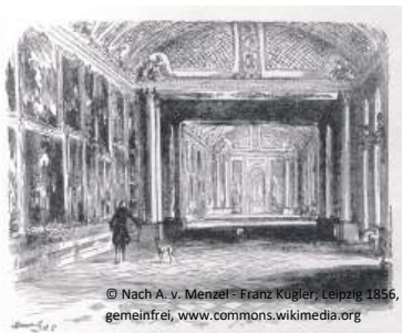
© Nach A. v. Menzel - Franz Kugler, Leipzig 1856, gemeinfrei, www.commonswiki.org

Treffpunkt: Eingang Bildergalerie auf Schloss Sanssouci-Ebene