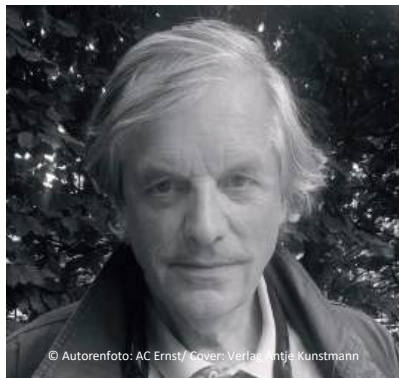
© Autorenfoto: AC Ernst/ Cover: Verlag Antje Kunstmann