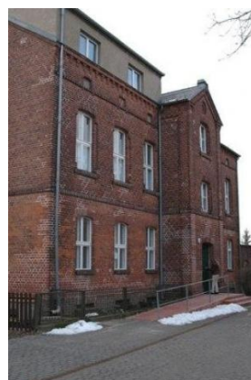
Altenhöfe in Lehnin und Deetz

In fünf Dörfern wurden solche Altenhöfe mit insgesamt 32 Wohnungen geschaffen, die mit dem Altenhilfezentrum verbunden sind und Beratung, Betreuung und Pflegediensleistungen ermöglichen.