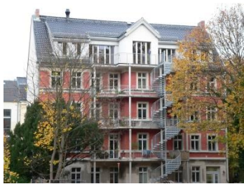
23 Riesen in Potsdam

Alten-WG/ Mehrgenerationenwohnen langer Weg - hohe Eigen-Aktivität Beratung und Finanzierung wichtig bisher noch die Ausnahme in BRB