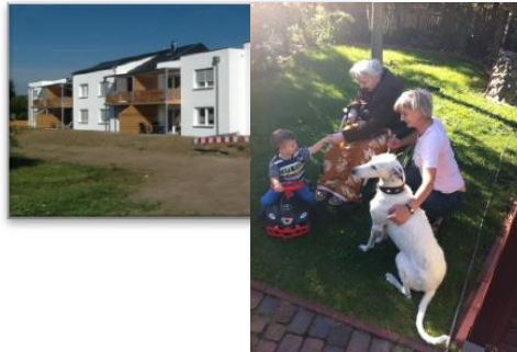
Felix Tempus - das besondere Wohnprojekt