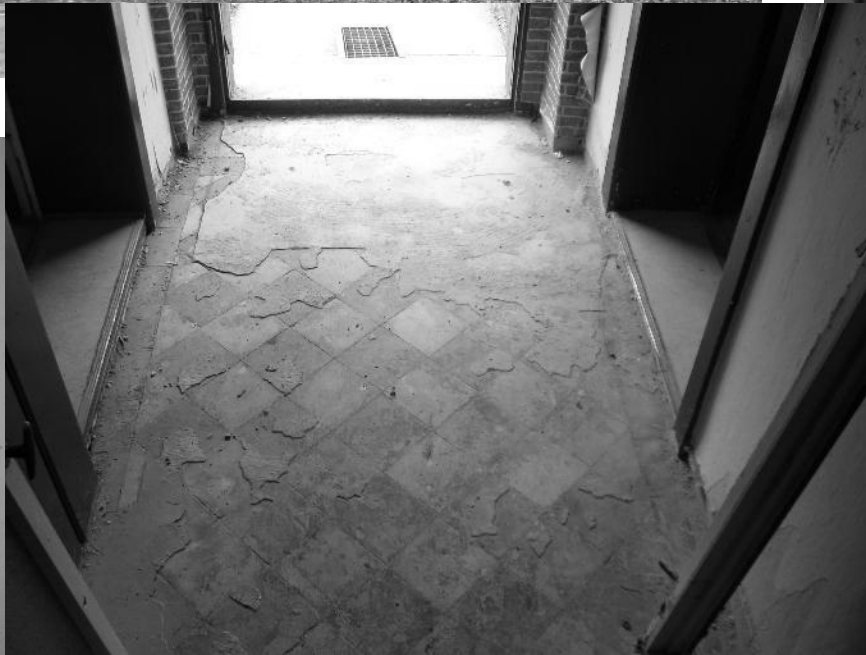
Flur ehemaliges Mehrzweckgebäude