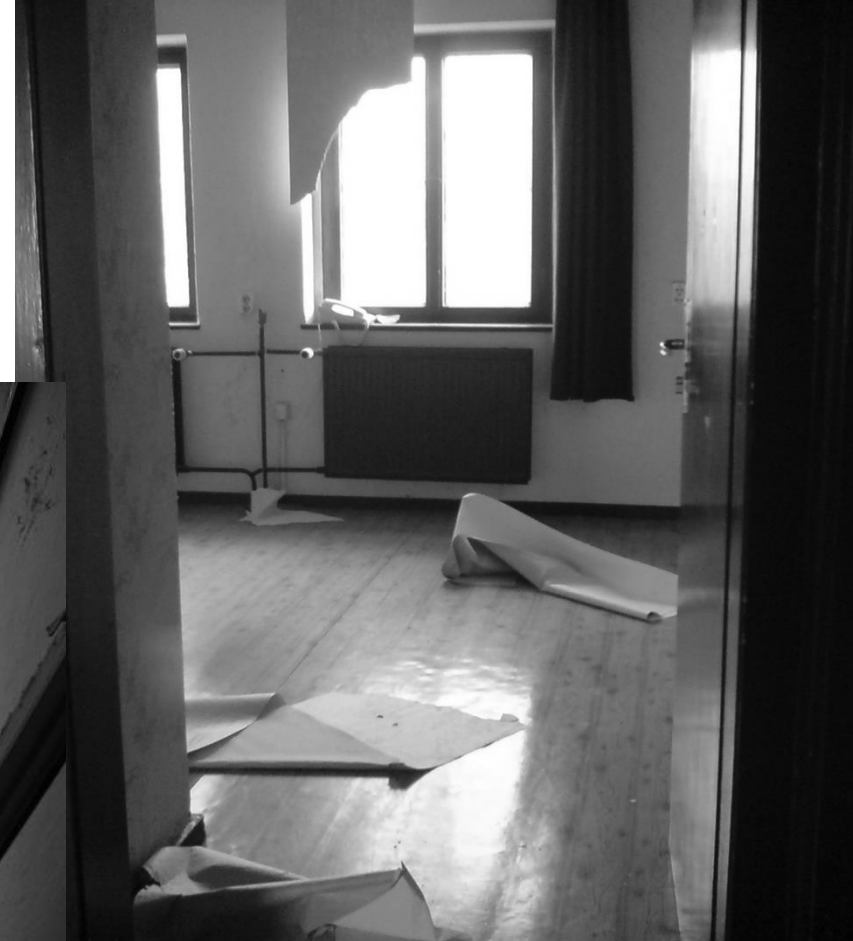
Innenansicht „Altes Forsthaus“