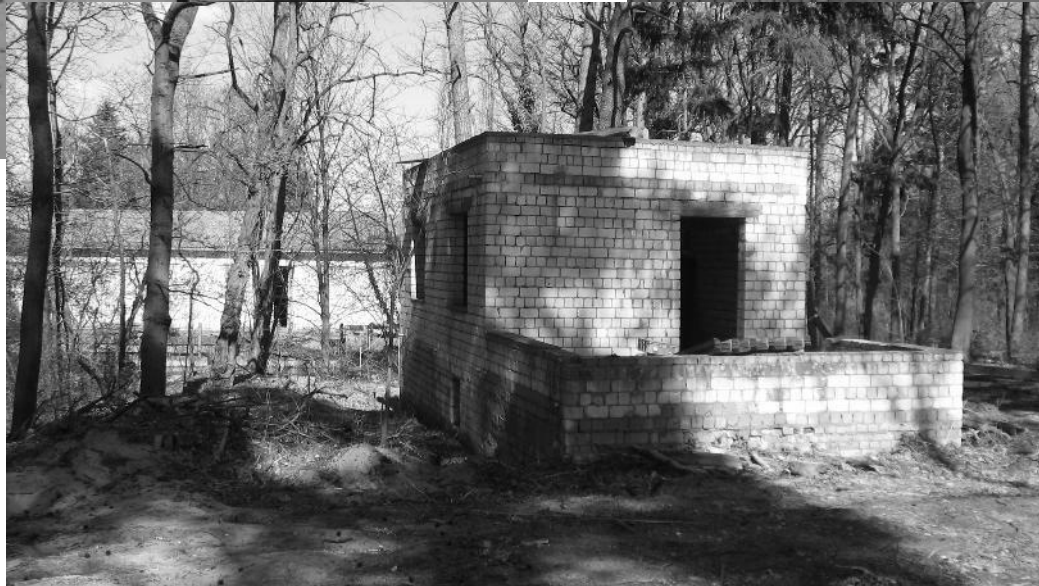
Ruinen auf dem Gelände