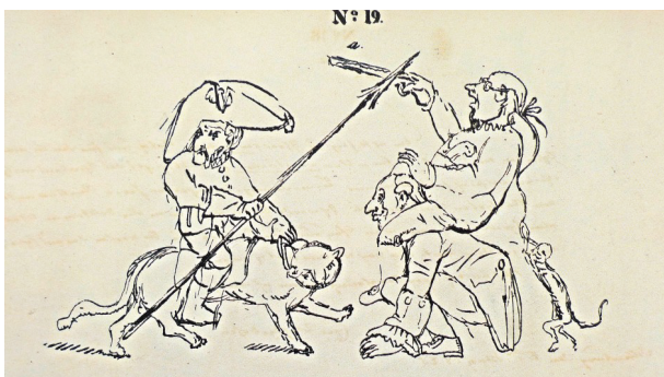
E.T.A. Hoffmann, Selbstporträt auf einer Katze reitend. Er zieht in den Kampf gegen die Bürokratie.